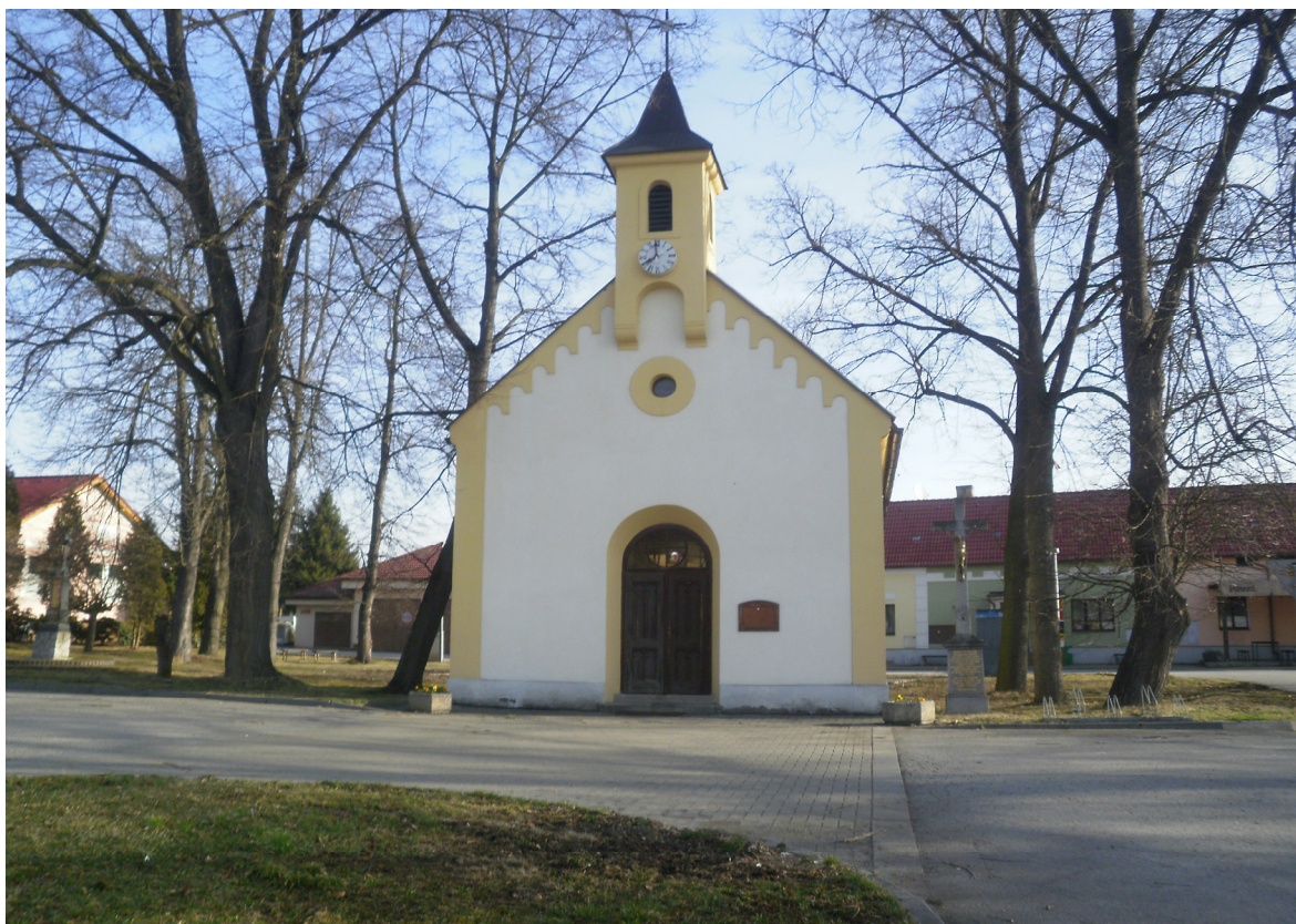
Příloha č. V Kaple v Mydlovarech