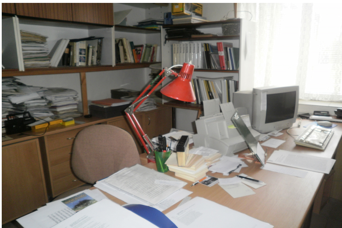
Příloha č. IX Pracovna v Botanickém ústavu AV v Třeboni