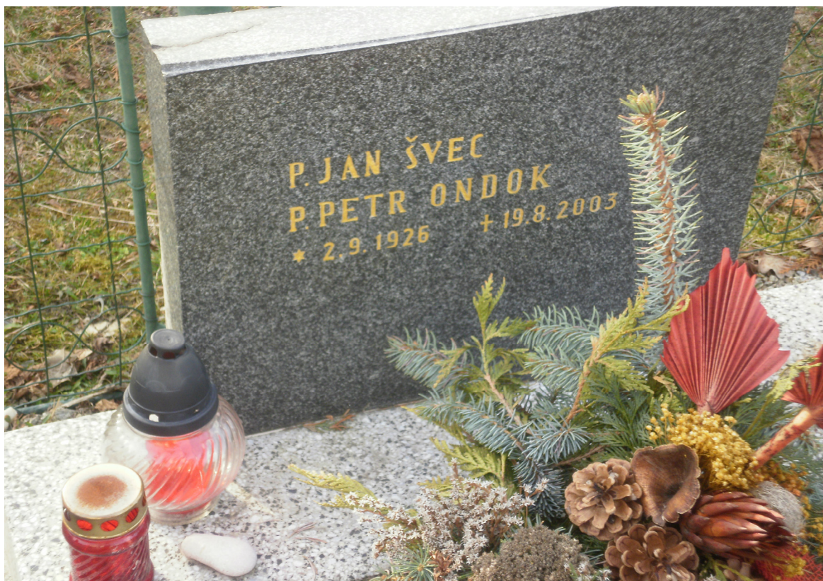
Příloha č. XI Náhrobek na hřbitově v Mladém