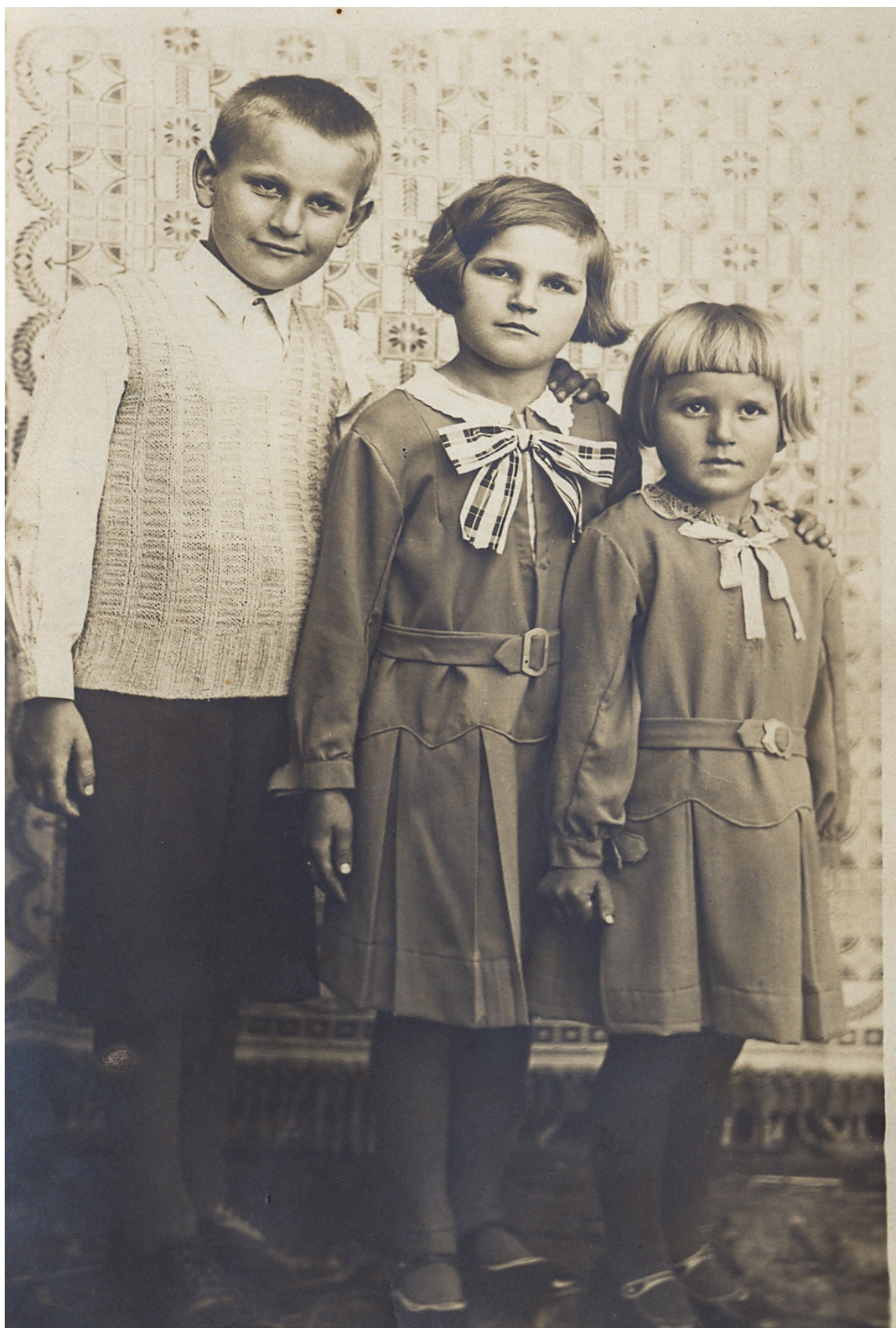
Příloha č. I Sourozenci Ondokovi