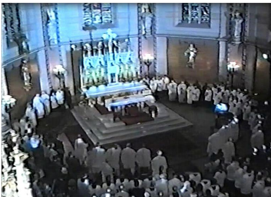
Biskupské svěcení v olomoucké katedrále