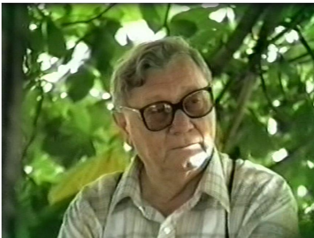
Den pro Agapé