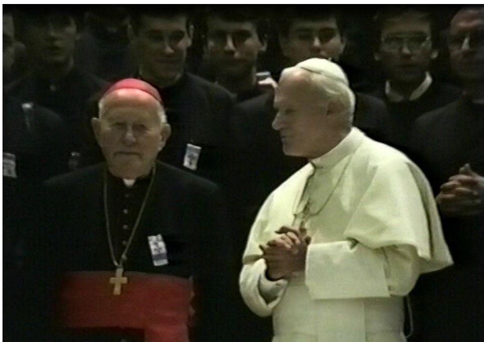
Píseň o veliké pouti