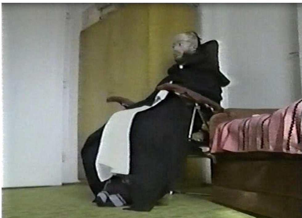
Obrazy na téma vyznání