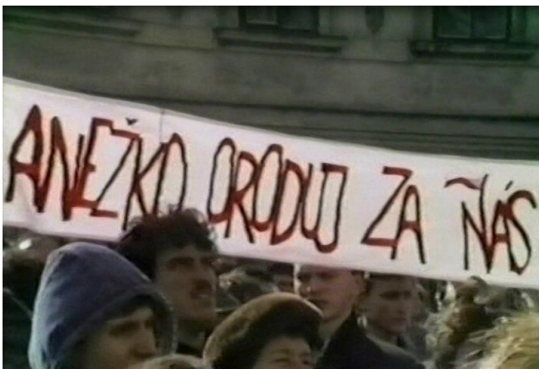
Setkání s kardinálem Tomáškem