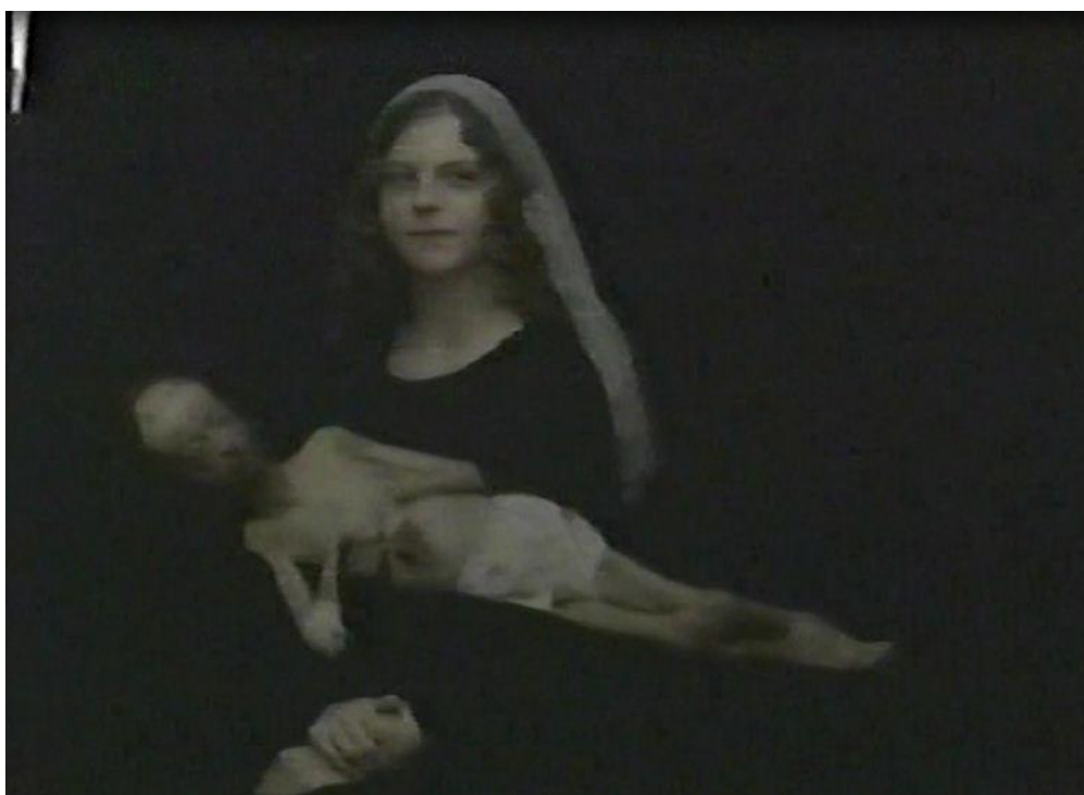
Obrazy na téma vyznání