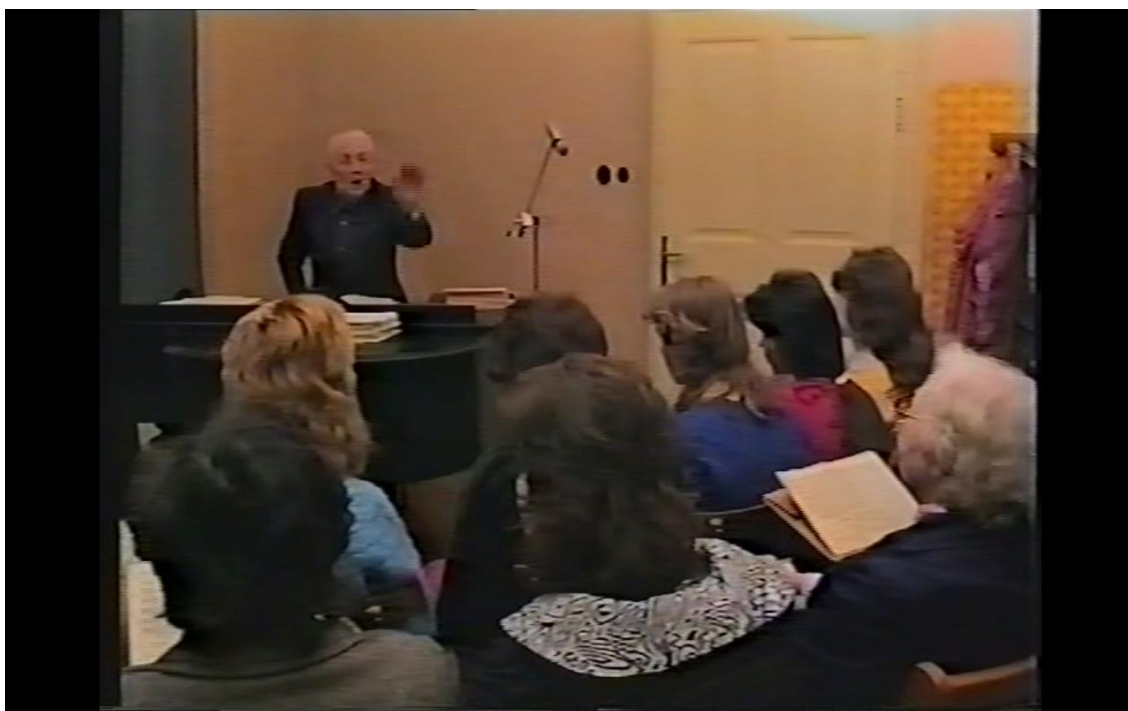
Česká mše z Andělské Hory