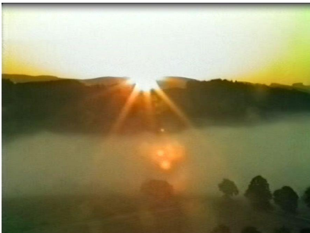
Den pro Agapé