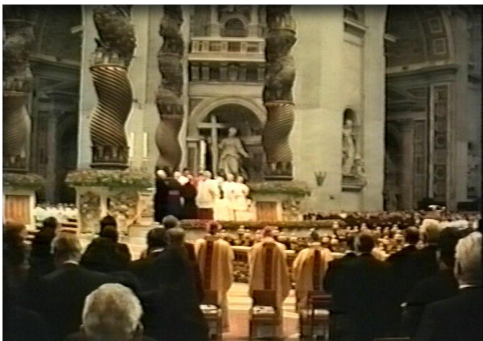
Píseň o veliké pouti