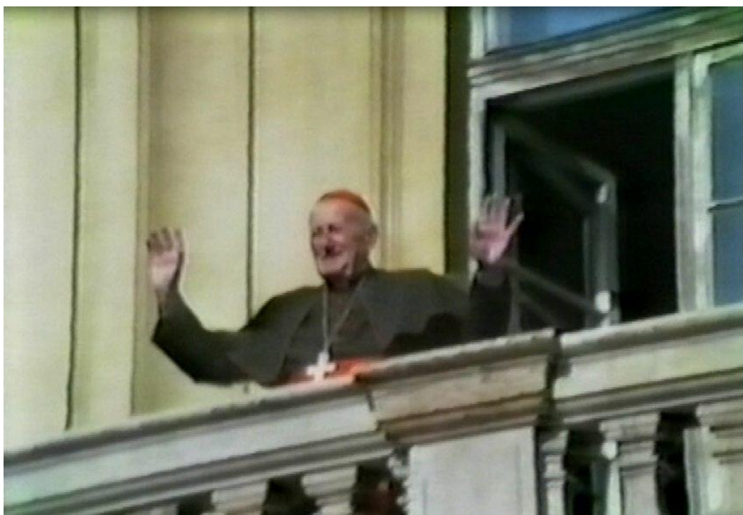
Setkání s kardinálem Tomáškem